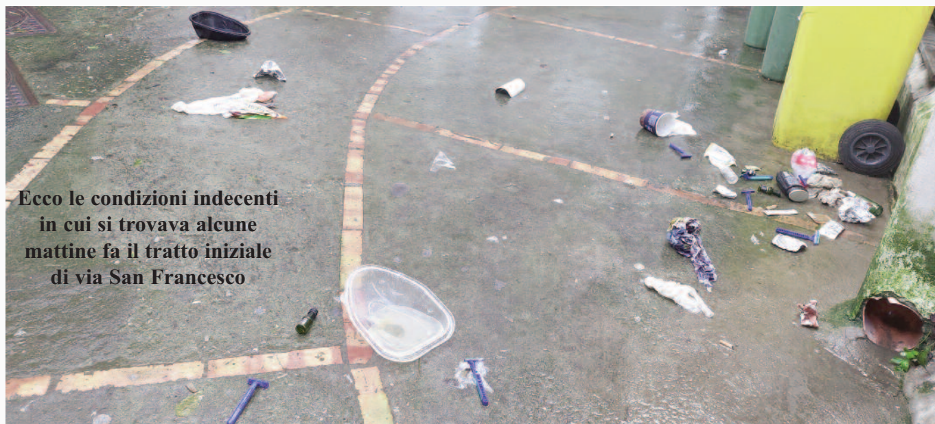
Ecco le condizioni indecenti in cui si trovava alcune mattine fa il tratto iniziale di via San Francesco